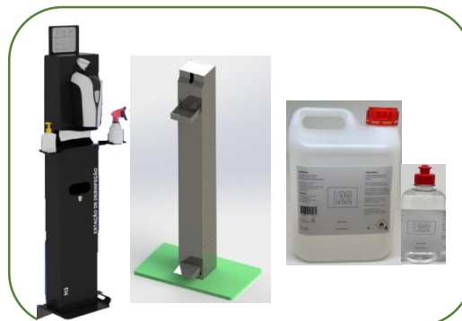
Dispensadores de Álcool Gel & Álcool Gel