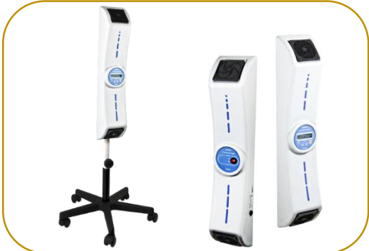
Sistema de Desinfecção UV