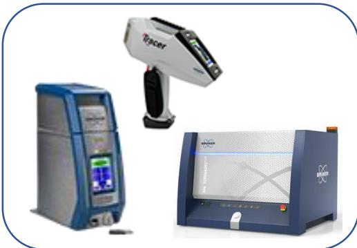
Fluorescência de RX