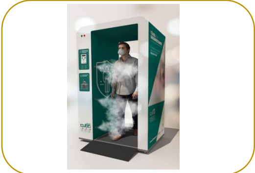
Túnel de Desinfecção de roupa com medição de temperatura corporal