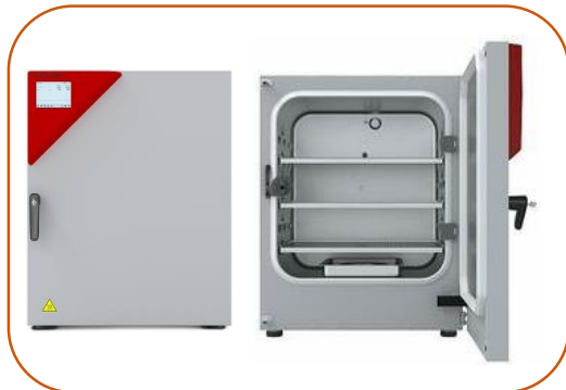
Incubadoras CO 2