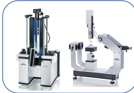
Analísadores de Espumas/Sprays