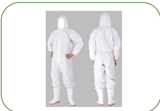
Fatos de Proteção