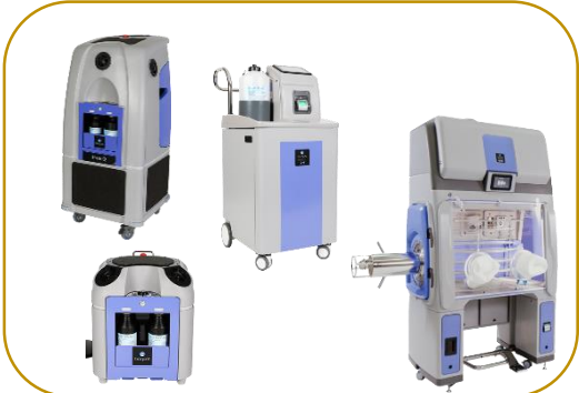
Sistemas Descontaminação H 2 O 2