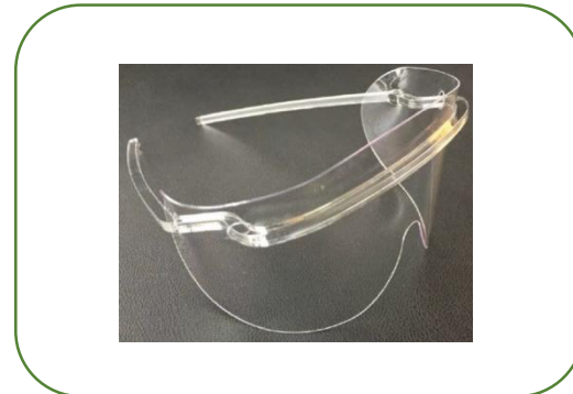
Óculos de Proteção