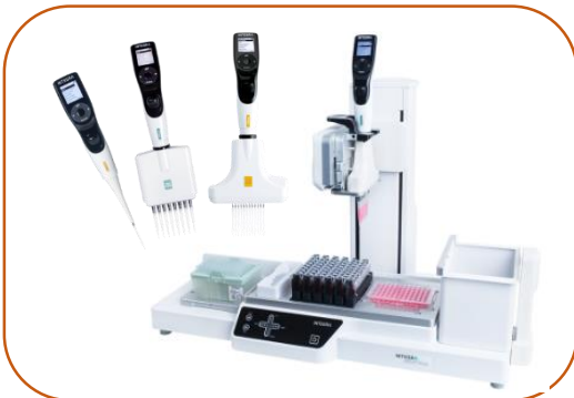
Pipetas e Robots Pipetagem