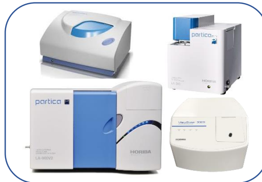
Análise de Partículas