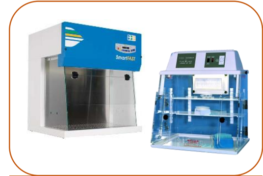
Câmaras de PCR