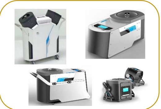
Sistemas de Desinfecção H 2 O 2