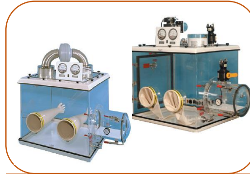
Câmaras de Luvas