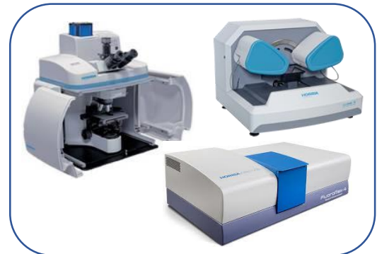
Raman, Elipsometria e Fluorescência