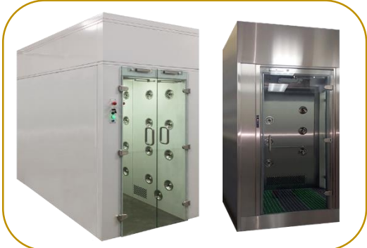
Chuveiros de Descontaminação Ar e Nevoeiro Ultrassónico