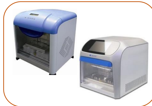
Extração Automática Ácidos Nucleicos