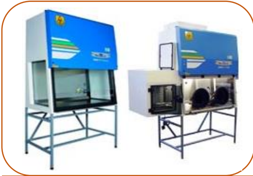
Câmaras de Fluxo Laminar e Isoladores